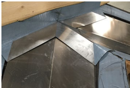
8. Nu ska vi have monteret pappet op af kip lægten. Dette kan gøres med papsøm eller klammer.