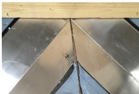
1. Skotrende profilerne klippes til i kip, ligeledes op mod kiplægten.

Fremgangsmåde med montering af denne top til Win Skotrende. Hvor 2 skotrender mødes i kip.