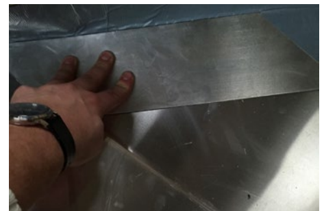
6. Monter fladerne ned mod skotrenden i kippen i den ene side.