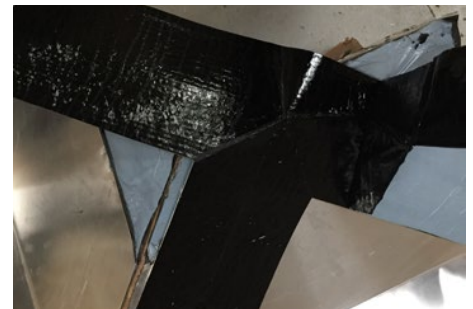
3. Når alt folien er fjernet er den klar til montage (evt. med Win2 eller en varmeblæser).