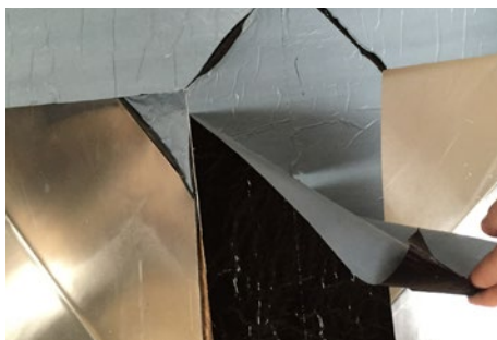
2. På bagsiden af toppen fjernes folien.