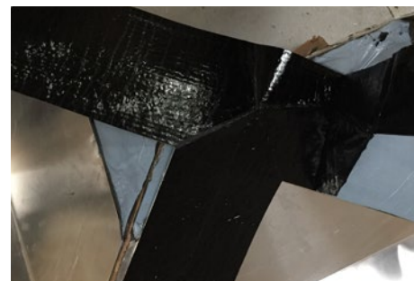
3. Når alt folien er fjernet er den klar til montage (evt. med Win2 eller en varmeblæser).