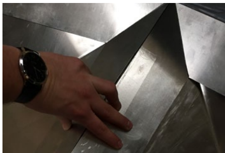
5. Nu monteres aluminiumen over samlingen af de 2 skotrender.