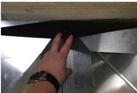
4. Pappen op mod kiplægten folles ned, så vi kan trykke fladerne med aluminium fast.