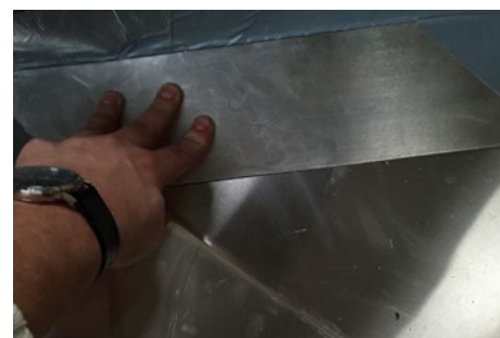
6. Monter fladerne ned mod skotrenden i kippen i den ene side.