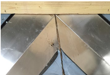
1. Skotrende profilerne klippes til i kip, ligeledes op mod kiplægte.