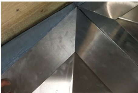
7. Derefter tilsvarende i den anden side.