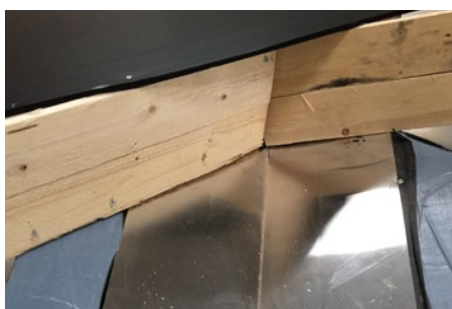
2. Skotrende profilerne klippes til op mod kippen.