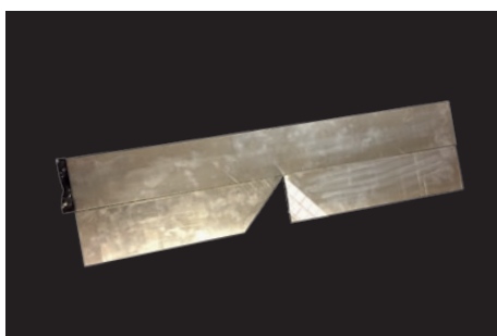
1. Toppen for huse med en skotrende.