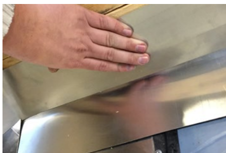
8. Herefter monteres højre side på samme måde.