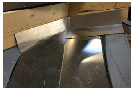
9. Færdigt og 100% vandtæt resultat.