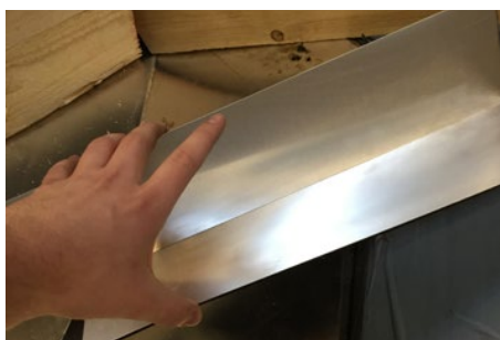
5. Nu monteres højre side af toppen. Dette gøres ved af folde toppen i 90° grader og trykkes på plads ned mod skotreden (det er nu butyltappen skal bruge).