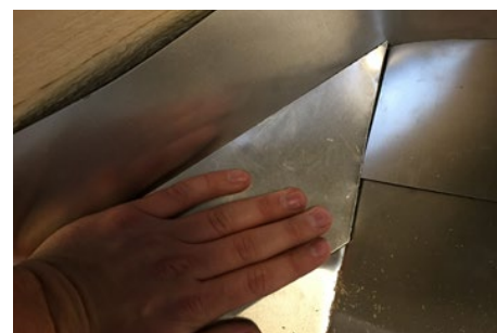
6. Derefter monteres venstre side af toppen, hvor den smigskåret del klæbes fast til butylen.