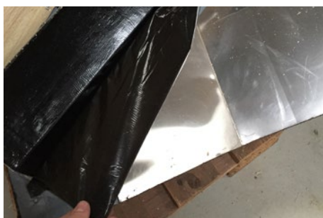
4. Nu fjernes folien på bagsiden af toppen, så den er klar til montage.