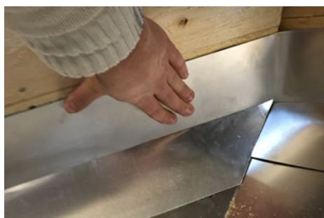
7. Monter alu del op af kip lægten. Klæbes på i venstre side, og evt monteres med papsøm i toppen.