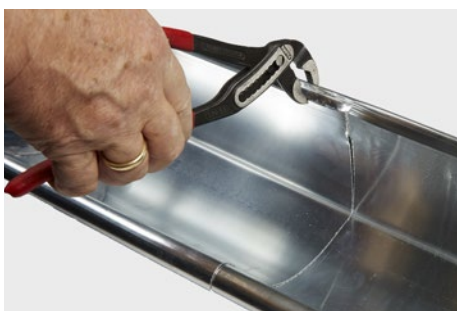
Bagkant bukes tilbage for at låse tagrende. Samme procedure i den anden side.