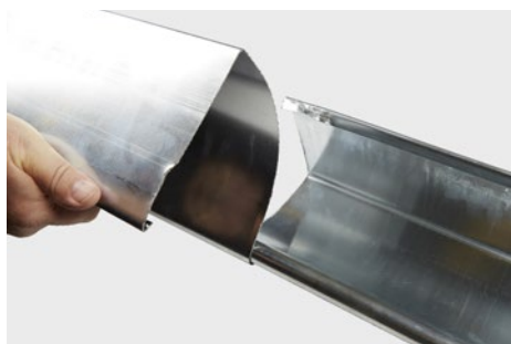
Ekspansionsstykke drejes ind i vulst på tagrende. Drejes rundt på plads. 50 mm overlap.