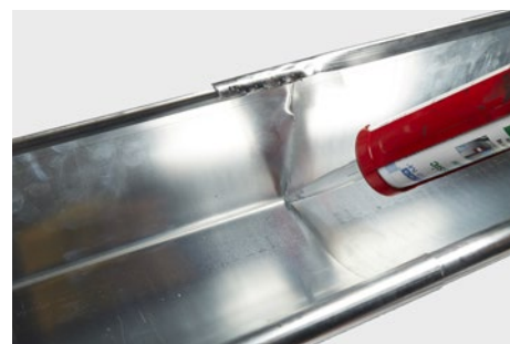
Fuges indvendig i kanten.