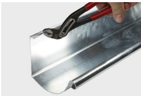
Opbukning af bagkant på tagrende inden påmontering af ekspansionsstykke.