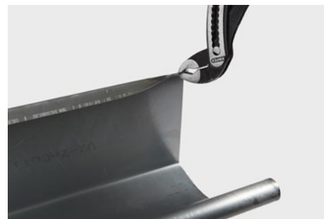
Opbukning af bagkant på tagrende inden påmontering af hjørne.