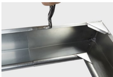
Bagkant bukket tilbage og låser hjørnet fast.