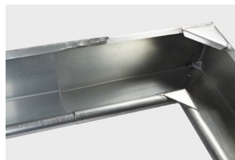
Presses på plads inden bagkant bliver bukket tilbage.