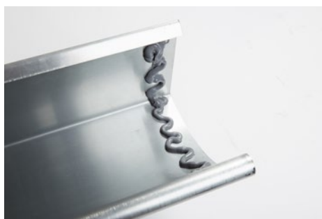
Limning af tagrende inden påmontering af hjørne.