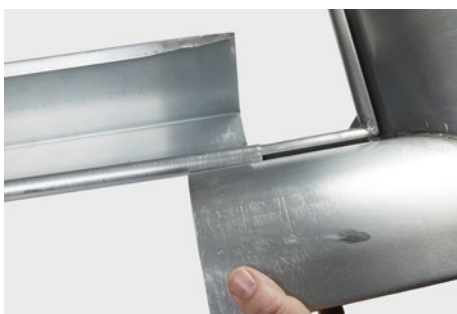
Hjørne drejes ind i vulst. 50 mm overlap.