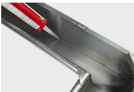
Fuges indvendig i kanten.