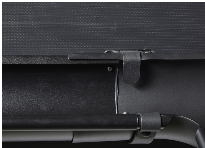
Tagrende skrues (samme princip som samling af tagrender).

Ved yderligere spørgsmål kontaktes Bygtjek A/S på tlf. 4043 4324