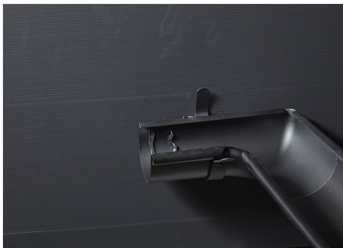
Indvendigt hjørne limes med Bygtjek Win Seal.